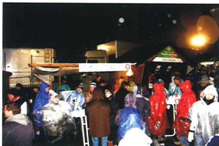
Gegen schlechtes Wetter gab es gute Kleidung für Außen und leckere Bratwurst, Glühwein und Suppen für Innen

Wir möchten uns heute bei allen Gästen unserer Hütte und vor allem bei allen Mitwirkenden und Mithelfenden bedanken, dass es nicht nur wieder eine spitzen Betreuung der Biathlonfans wurde, sondern dass durch die erzielten Einnahmen die Kosten für Wachs, z.T. Ausrüstung und natürlich unseren Bus zur Unterstützung der Nachwuchsarbeit im Biathlon am SGO größtenteils für das kommende Jahr gesichert wurden.