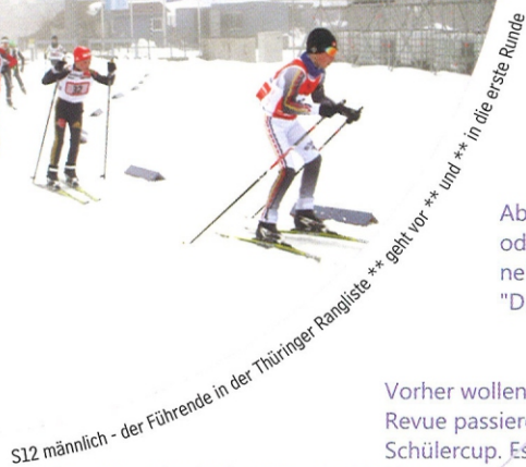
S12 männlich - der Führende in der Thüringer Rangliste ** geht vor ** und ** in die erste Runde