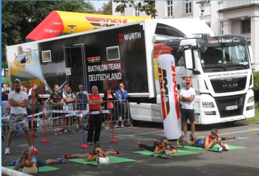
DSV Wachs Truck und Shooting Star in Zella-Mehlis 2016