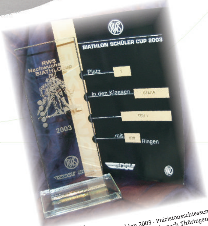
Begehrte Trophäe: Beim RWS Nachwuchscup Biathlon 2003 - Präzisionsschiessen gingen in beiden Alterskategorien die Pokale nach Thüringen

Auch in diesem Jahr waren die RWS - Finalveranstaltung in Willingen (vom 03.-05.10.03) für unsere 12-15 jährigen, sowie der SK Landespokal (vom 10.-12.10.03) für unsere 16-19jährigen in Oberhof Standortbestimmung unserer Leistungsfähigkeit in Richtung Winter.