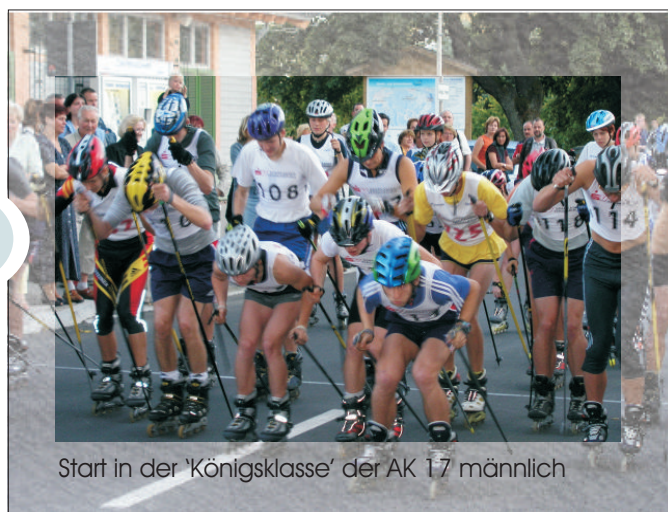
Start in der 'Königsklasse' der AK 17 männlich